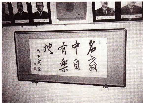
幾堂の署名がある町田の書（秋田高校会議室）