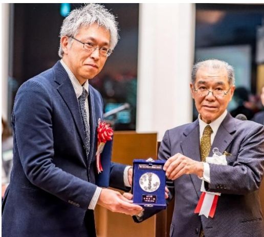
奨励賞の銀牌(メダル)を授与