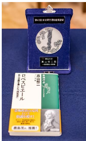
受賞対象著書 ロベスピエール 民主主義を信じた「独裁者」 発行 新潮社