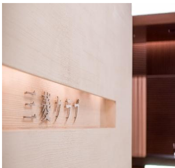
会場の三菱クラブ