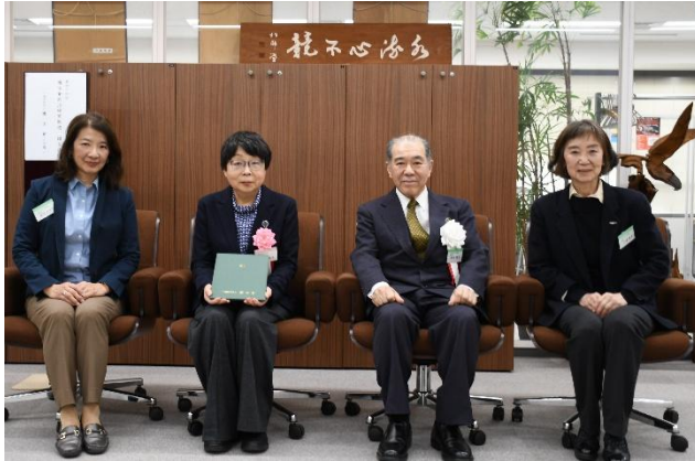
後日行われた表彰式・贈呈式の記念撮影