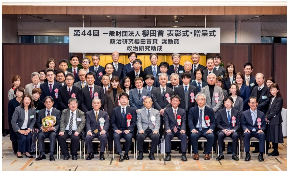
参加者全員での記念撮影

櫻田會は2034年の100周年に向け、研究者の皆さまとともに事業を通じて政治学の発展に寄与してまいります。