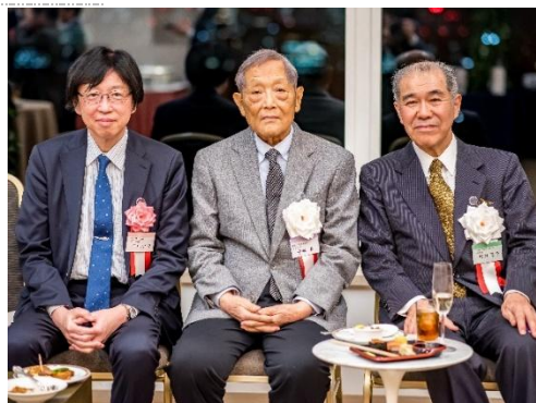
和気あいあいと談笑される皆さま